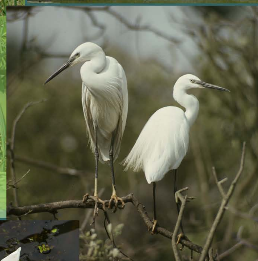
Volavka striebriстая Egretta garzetta