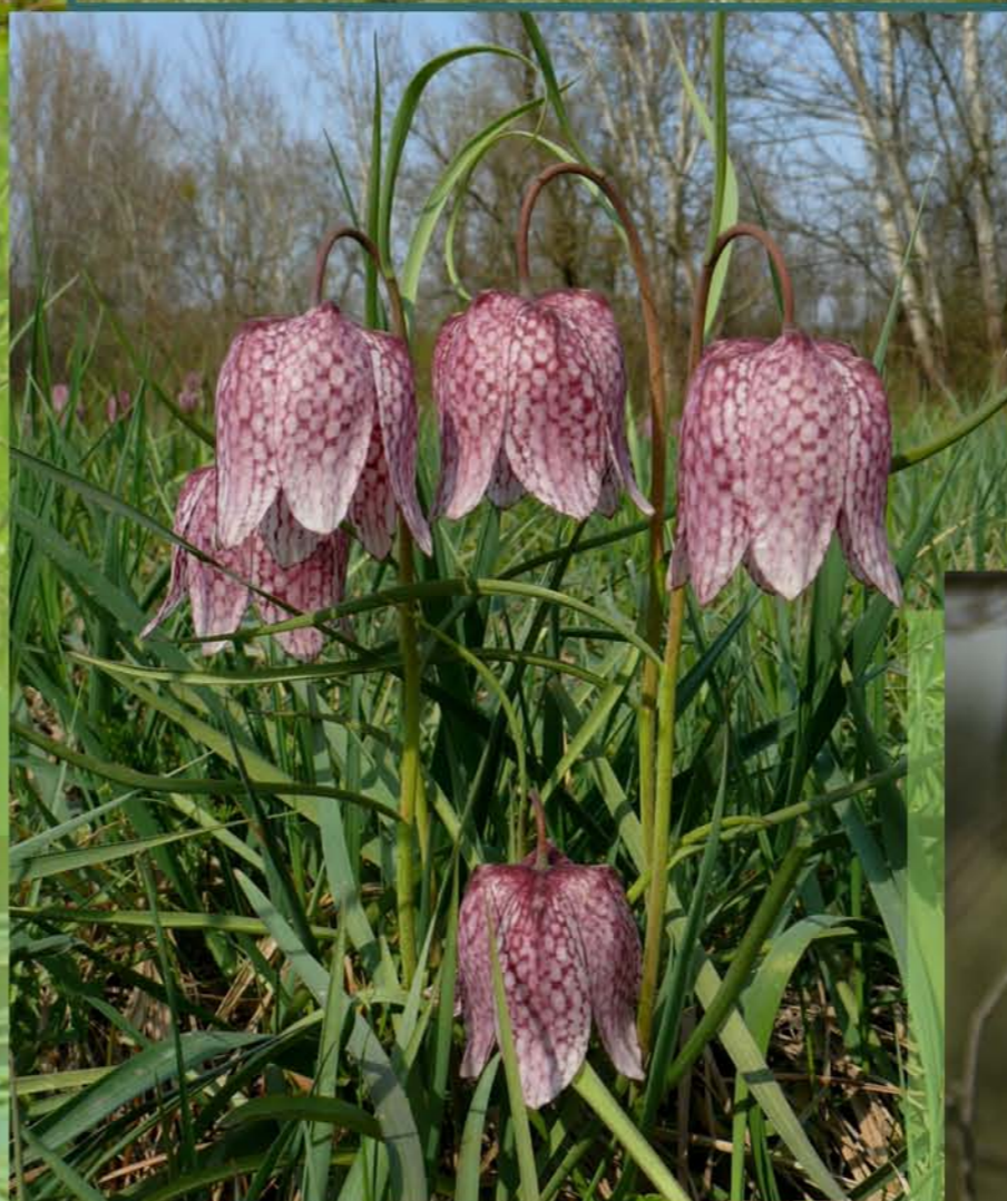
Korunkovka strakatá Fritillaria meleagris