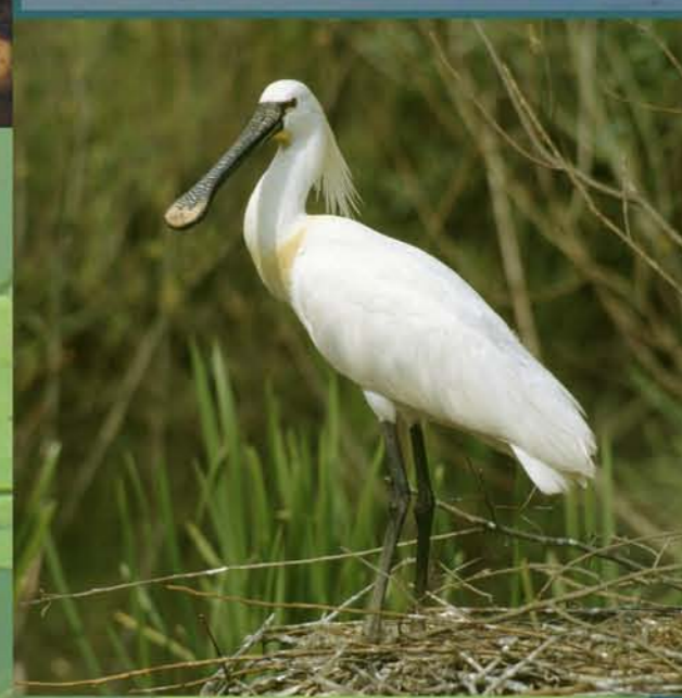
Lyžičiar biely Platalea leucorodia

Mokrade predstavujú ekosystémy na prechode medzi vodným a suchozemským prostredím. Tvoria životný priestor pre mnohé druhy mikroorganizmov, rastlín a živočíchov. V súčasnosti patria medzi najohrozenejšie biotopy. Významné mokrade Východoslovenskej nížiny sa nachádzajú v chránených vtáčích územiach Senianske rybníky a Medzibodrožie.