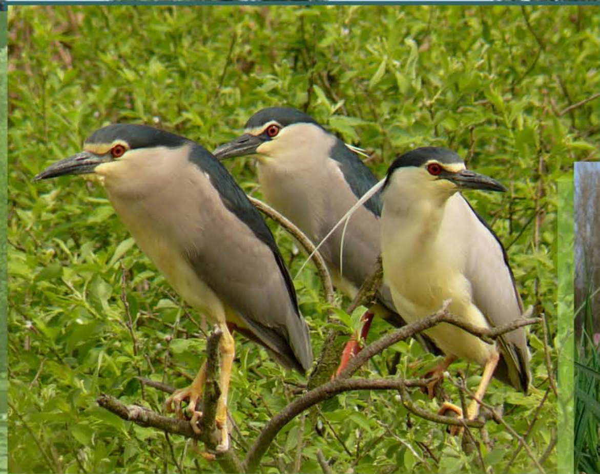
Chavkoš nočný Nycticorax nycticorax