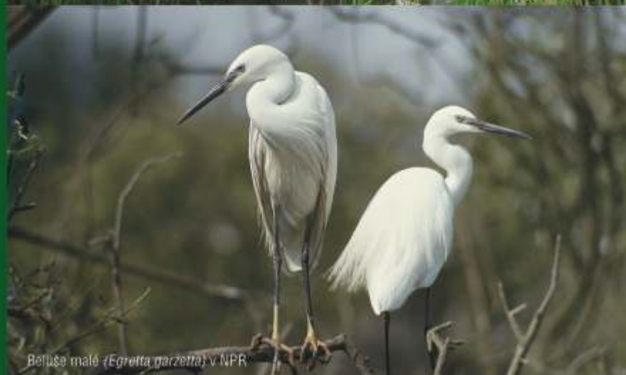
Befuše malé (Egretta garzetta) v NPR