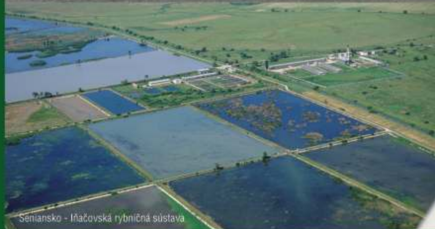
Seniansko - Iňačovská rybníčná sústava