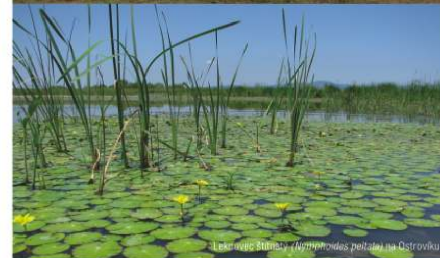
Lekovec štítnaty (Nymphaeoides peitana) na Ostroviku