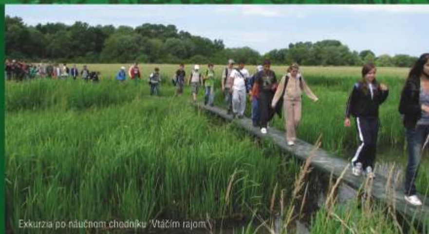
Exkurzia po náučnom chodníku "Vtáčim rajom"