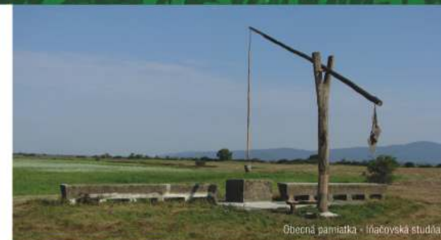
Obecná pamiatka - Iňačovská studňa