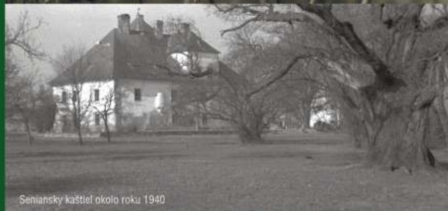
Seniansky kaštieľ okolo roku 1940