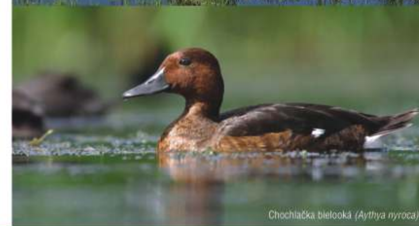
Chochlačka bieleoká (Aythya nyroca)