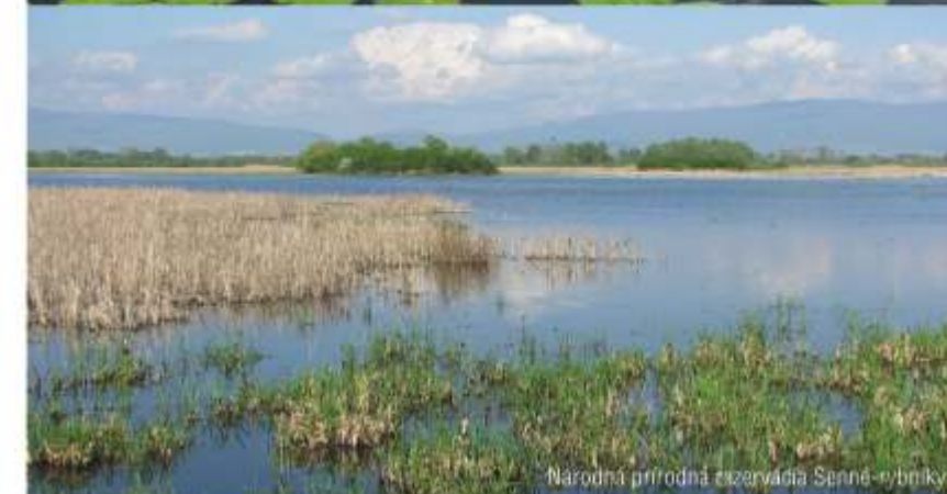
Národná prírodná rezervácia Senné-rybníky